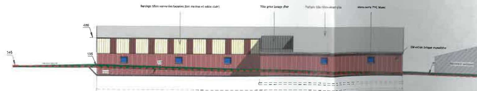
COUPE DE TERRAIN NATUREL ET FACADE NORD