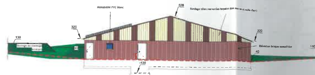
COUPE DE TERRAIN NATUREL ET FACADE OUEST